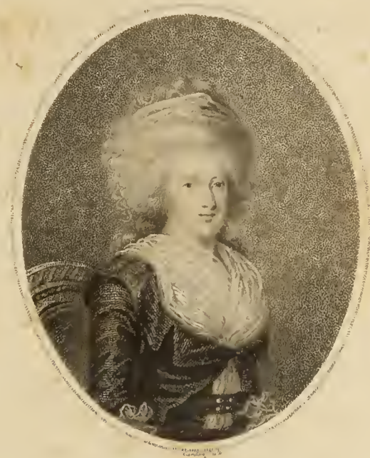
MADAME ELISABETH de FRANCE.

Ton Nom étoit sans tache aufsi bien que ton Âme